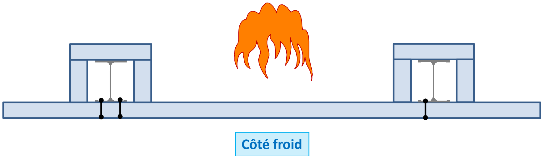
Schéma CTICM: solution de paroi métallique pour écrans thermiques et murs CF

Le nouveau dispositif est composé de panneaux sandwich ayant un classement EI120 assemblés sur des poteaux métalliques porteurs et encoffrés sur toute leur hauteur par le même type de panneaux EI120.